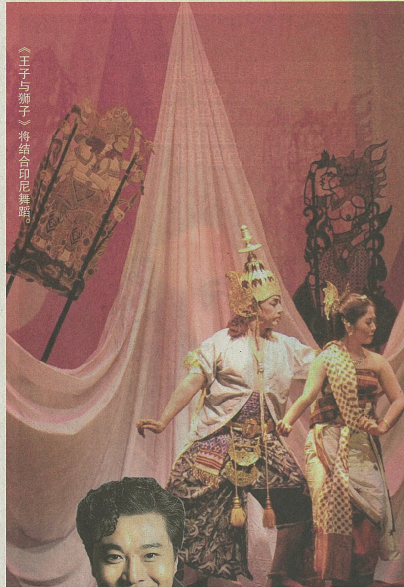
《王子与狮子》将结合印尼舞蹈。