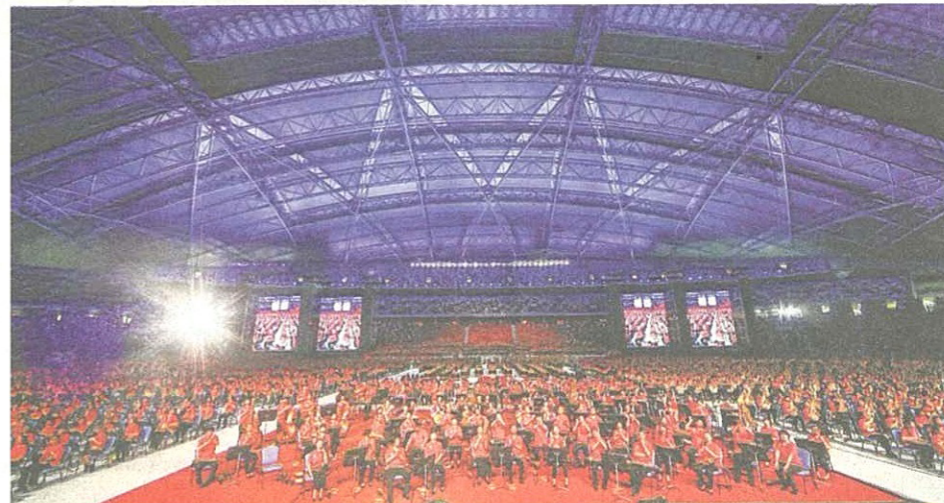
新加坡华乐团举办的“全民共乐2014”, 缔造两项健力士世界纪录。(档案照)